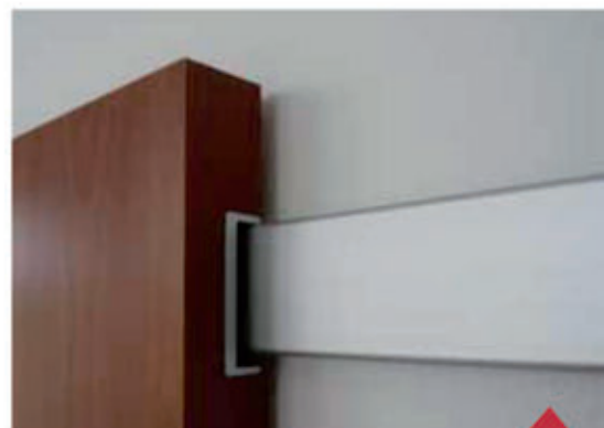
Detail posuvných dveří na posuv ALU