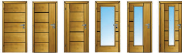
MP 10 MP 11 MP 12 MP 40 MP 50 MP 51