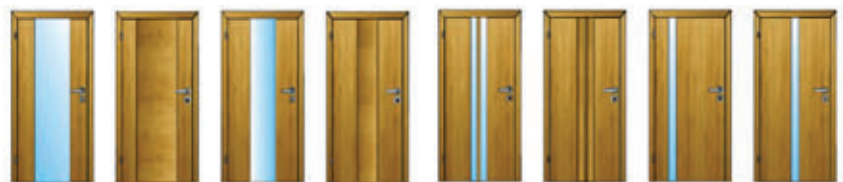
V 1 V 2 V 3 V 4 V 5 V 6 V 7 V 8