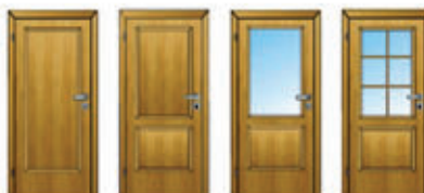
OL 41 OL 34 OL 31 OL 33