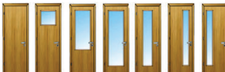
A 10 A 11 A 20 A 21 A 50 A 51 A 52