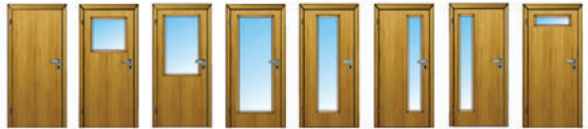
S 10 S 20 S 30 S 40 S 50 S 60 S 61 S 70