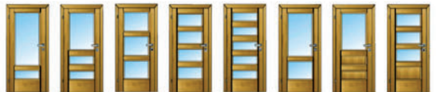
SO 42 SO 43 SO 48 SO 49 SO 45 SO 47 SO 33 SO 39