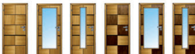
CR 10 CR 40 CR 50 CR 11 CR 44 CR 55